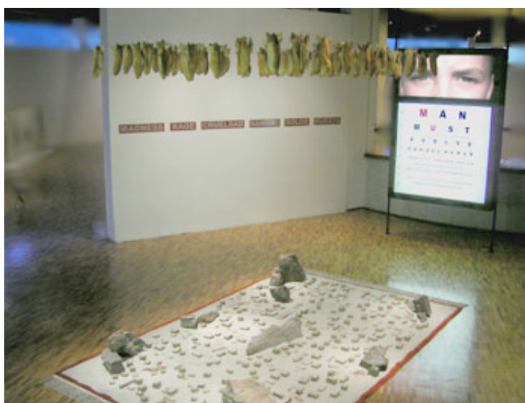
Marcos Ramírez "La multiplicación de los panes"