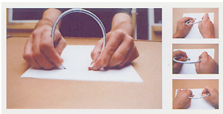
Máximo González "Lápiz-goma"

arrojar alimento al tiempo que bombas en el conflicto de USA en Afganistán.