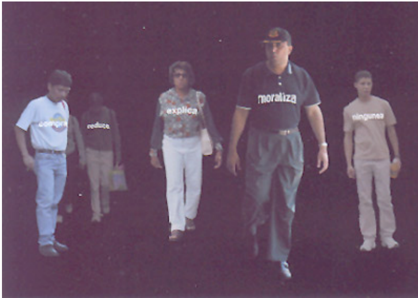
Rafael Lozano.Hemmer "Público subtitulado"

Aún así la muestra ofrece un amplio panorama del desarrollo de la técnica en la evolución del arte mexicano actual aunando las estrategias estéticas de herramientas para la emoción a las estrategias de armas críticas y demandantes en lo social y político.