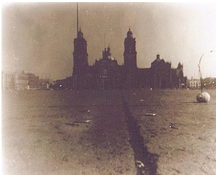
Carlos Jurado "Catedral con monedas"

Otra pieza, un video proyectado ampliamente sobre la pared muestra la paulatina acción de escribir, con un peculiar lápiz-goma flexible, unos nombres con la mano derecha mientras que la izquierda se encarga de hacerlos desaparecer con el borrador de la punta extrema. Los nombres que escribe y posteriormente suprime son los de destacados protagonistas de la cultura a los que el artista se dirigió tiempo atrás sin recibir ninguna respuesta.