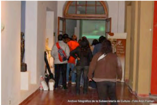
Archivo fotográfico de la Subsecretaría de Cultura - Foto Arón Fisman