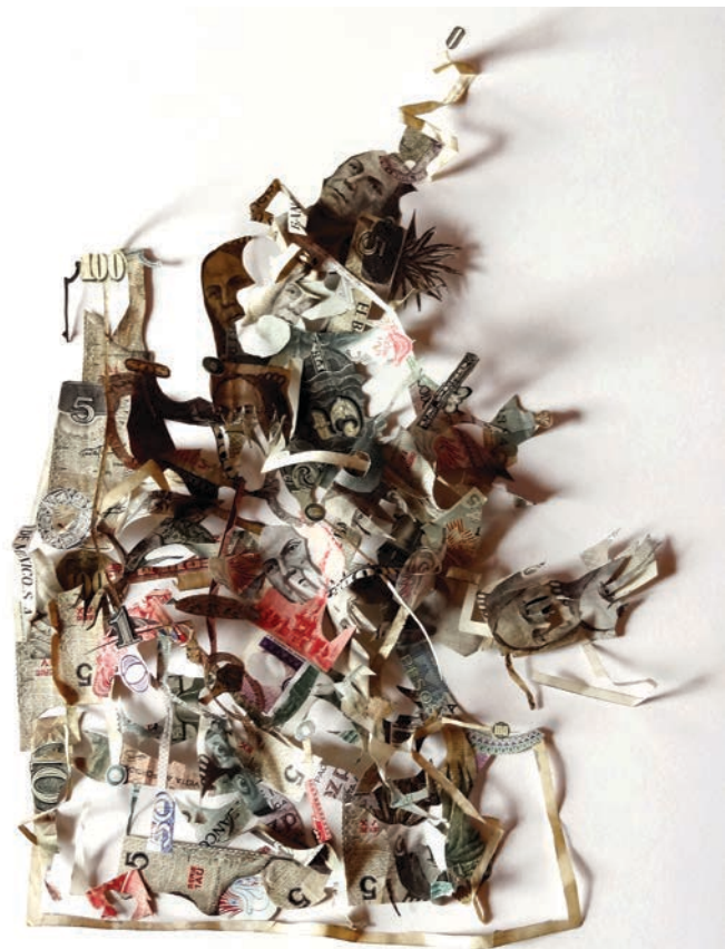
Basura sin paisaje. Collage, papel moneda fuera de circulación. / LANDSCAPE-LESS TRASH. COLLAGE, BANKNOTES WITHDRAWN FROM CIRCULATION. 40 x 30 cm, 2012.